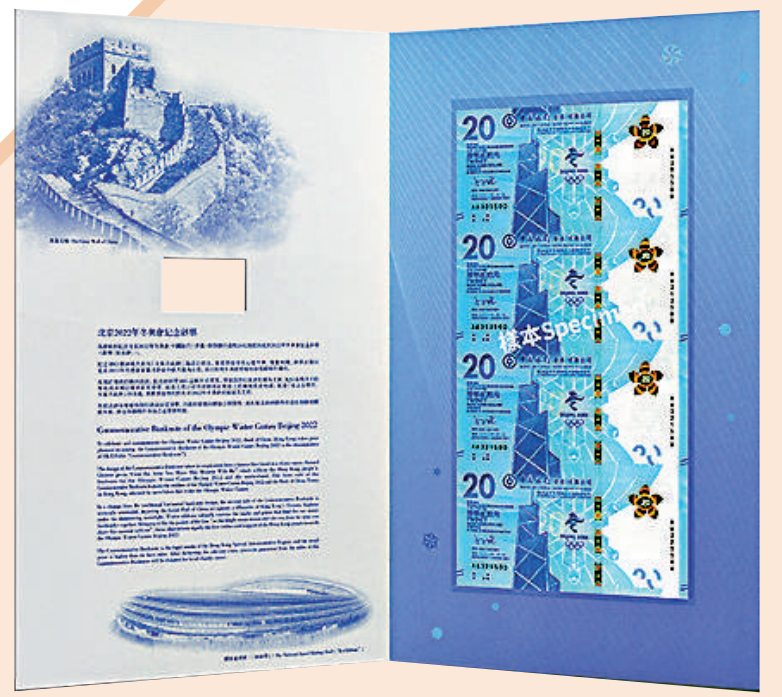
中銀明日將發行北京二〇二二年冬奧會紀念鈔票，共發行兩萬套，每套售三百八十八元。圖為四連張。