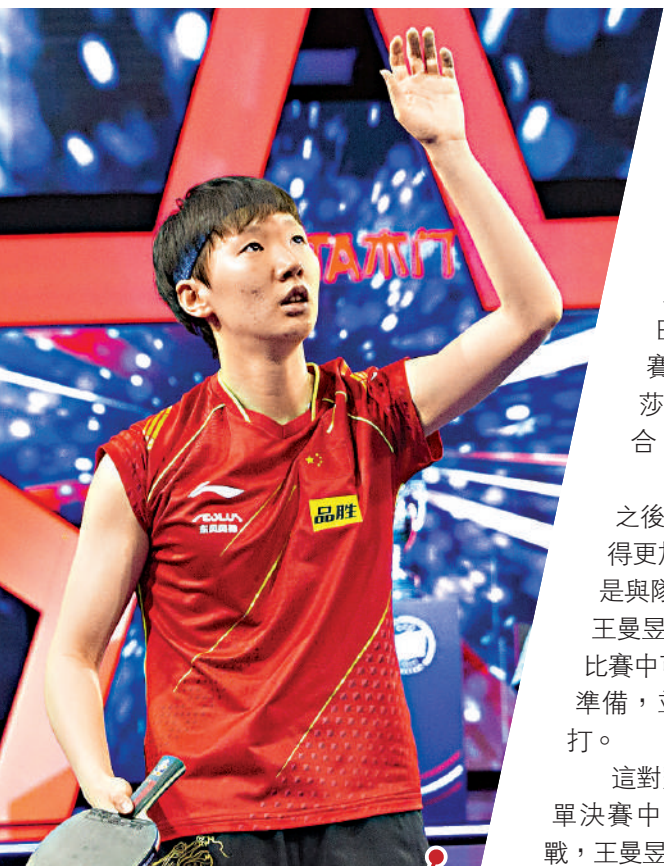
▲王曼昱力克隊友孫穎莎奪得女單冠軍。