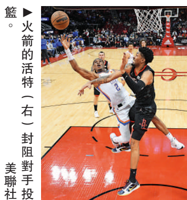
▲火箭隊的活特（右）封阻對手投籃。