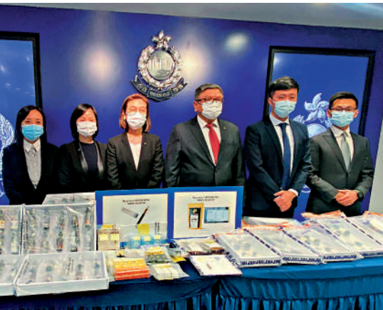
▲警方毒品調查科本月搜查九間店舖，檢獲包括煙油及咖啡粉等逾1500件產品，當中部分含THC成分，至少拘捕11男女。