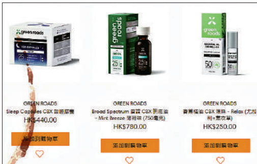
▲部分CBD產品網站昨日仍有出售Green Roads的刪底油等產品。

警方搜獲標籤受《危險藥物條例管制》THC成分的咖啡粉，涉案品牌為Green Roads，是美國一間大型網上CBD商店，早在2013年殺入本港，其網頁稱作為香港最大的CBD網上商店，提供超過100款產品，並聲稱所有產品均經人手挑選，保證不含THC，符合香港法律。昨日Green Roads