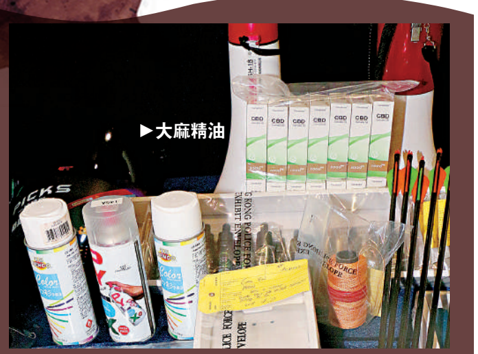
▲警方在2019年8月搗破「港獨」分子位於火炭的武器庫，搜出大麻精油及改裝氣槍等。