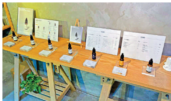
▲警方在Olanda共檢獲約40種不同類型懷疑含有四氫大麻酚的製成品。

藥物條例》含有任何濃度的THC物品均被視作危險藥物。警方在本月展開行動打擊售賣含THC產品。