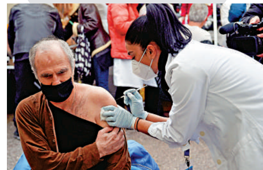
▲一名長者11月26日在希臘北部的塞薩洛尼基市接種疫苗。

家，就特定年齡組別作出類似規定。希臘當局早前已經規定，禁止未打針的民眾進入餐廳、戲院、博物館等室內場所。