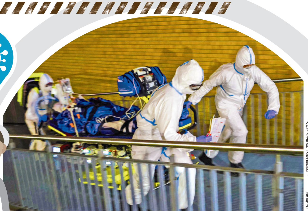
▲德國醫護人員11月28日將新冠病毒人送入基爾大學醫院。