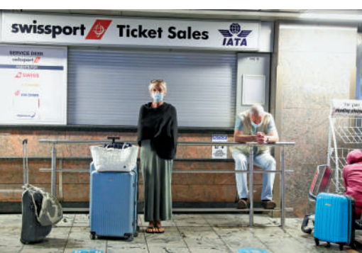
▲乘客11月28日在約翰內斯堡機場候機。

密歇根大學語言學教授、非洲研究中心主任科茲說，上周末間飛歐洲的航班取消後，他只能在酒店通過Zoom給學生上網課。「我很幸運，能夠繼續工作，這對許多人來說是不可能的。」