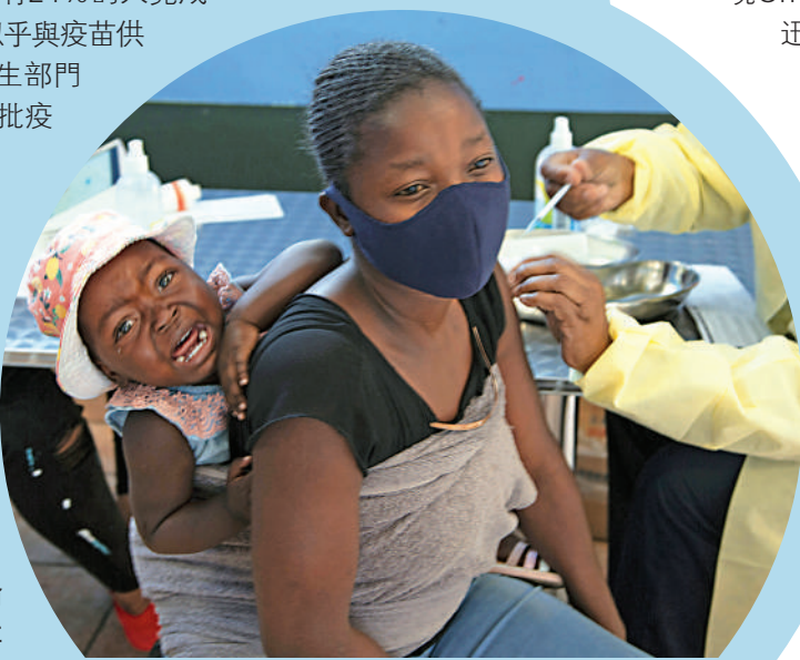
▲一名南非婦女10月21日在約翰內斯堡附近接種疫苗。

分析指，與許多歐美國家一樣，南非政府正在和疫苗懷疑論和陰謀論做鬥爭。對於疫苗效力和副作用，公眾接收到的信息十分混亂，例如此次Omicron的確診者中有人已經完成疫苗接種，這些新聞的傳播加深了疫苗懷疑論。