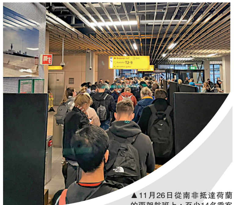
▲11月26日從南非抵達荷蘭的兩架航班上，至少14名乘客感染Omicron。