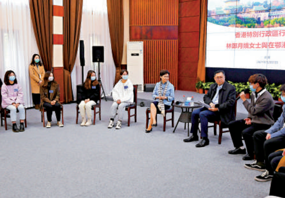
▲林鄭月娥與在鄂港生交流。

林鄭月娥昨日早上在湖北省副省長趙海山陪同下，考察湖北碳排放權交易中心。她表示，香港特區定下進取的減碳排放策略和措施，力爭2050年前達至碳中和的同時，可發揮作為國際金融中心的地位和優勢，發展綠色金融產品，並積極探討與湖北的合作，助力國家實現2030年碳達峰和2060年碳中