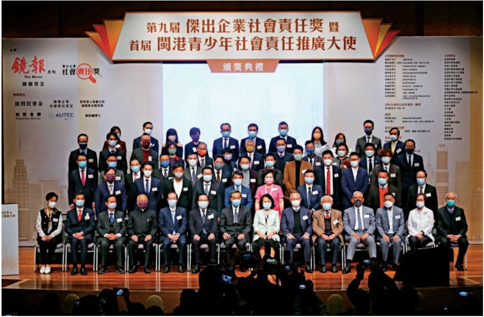
▲「第九屆傑出企業社會責任獎」暨「首屆閩港青少年社會責任推廣大使」頒獎典禮昨日舉行。

評選活動亦加入青年的元素，今年福建和香港首創在兩地共同舉辦的「閩港青少年社會責任推廣大使」評選活動，鑒於疫情，頒獎典禮採取線上線下互動的方式，兩地實時同步進行。在頒獎典禮上，閩港兩地共24名中小學生以及18名大學生，獲得「社會責任推廣大使」稱號，12所中小學被評為「優秀社會責任教育推廣單位」。