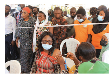
▲尼日利亞民眾12月1日接種阿斯利康新冠疫苗。

板第4因子」的蛋白質，並與其結合。在罕見情況下，人體免疫系統會誤將結合後疫苗與「血小板第4因子」當成病毒，並釋放抗體攻擊，抗體會與「血小