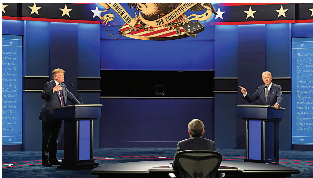
▲去年9月29日，時任美國總統特朗普（左）與民主黨候選人拜登（右）在俄亥俄州進行首場大選辯論。

【大公報訊】綜合《衛報》、《華盛頓郵報》、BBC報道：美國前白宮幕僚長梅多斯在即將出版的新書中爆料，前總統特朗普去年曾隱瞞自己的新冠檢測結果。梅多斯指出，特朗普於去年9月26日得知自己的新冠檢測呈陽性，但他不顧助手勸阻，仍於三日後（9月29日）與民主黨總統候選人拜登進行了首場總統選舉辯論會，並且未有遵循戴口罩等防護措施。