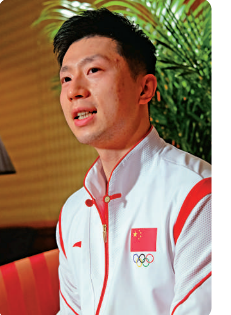
▲馬龍表示出席活動比較繁忙，但非常有意義。