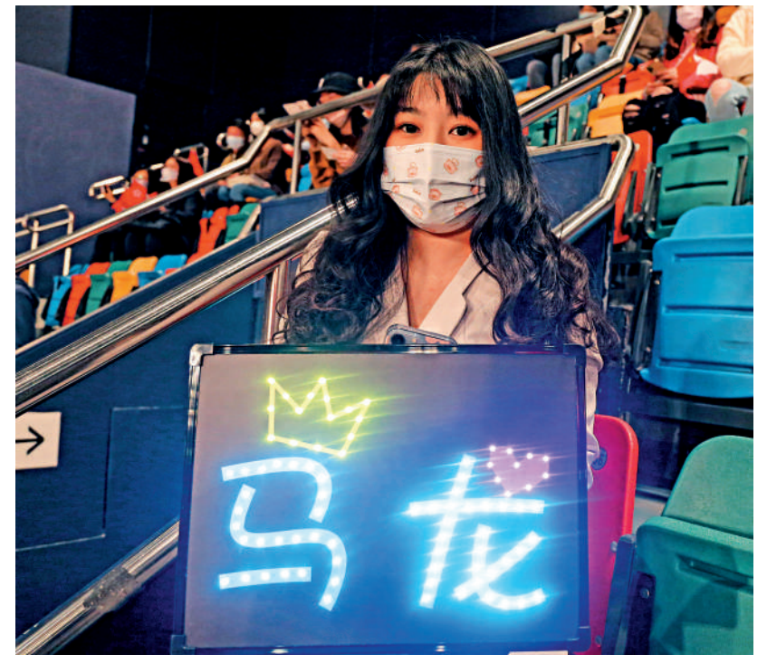
▲馬龍粉絲小姐特意上網買了一張偶像燈牌，為偶像打氣。