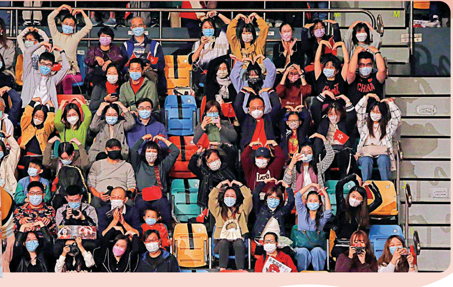
▲市民做出心形手勢支持奧運健兒。

【大公報訊】據新華社報道：東京奧運會內地奧運健兒代表團昨天兵分多路出席不同活動，其中金牌運動員石智勇、汪周雨、李雯雯、鍾天使、孫夢雅和教練張秀雲一起到香港專業進修學校，與香港青少年交流互動，暢談體育與人生、成功與失敗、奮鬥與堅持，以及為國爭光的民族自豪感。互動交流中，主持人向在座的近兩百名中小學生提出情境設問：中國男子舉重選手石智勇在東京奧運會前一個月，大腿兩次意外拉傷，導致17天不能訓練。如果帶傷出戰，有可能傷情加重。現場學生手中都有兩個塑料充氣棒，選擇繼續出戰的就舉槓棒，反之為藍棒。很快，現場就是一陣橘色和歡呼聲。石智勇分享時說：「我和你們的選擇一致。不過這裏有個前提，就是我是一個人在戰鬥，我對整個舉重保障團隊充滿信心，我相信他們可以把我的傷情控制在可以比賽的範圍內。」現場除了情境問答交流外，還有奧運知識答題等環節。交流開始前，現場全體起立，面向國旗唱國歌。