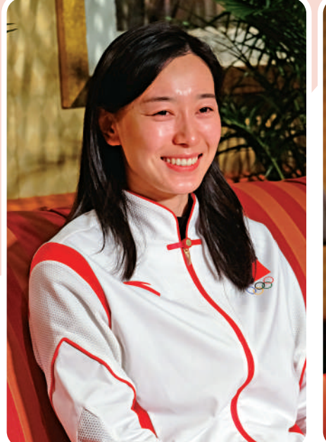
▲孫一文坦言與香港運動員在場下是朋友。