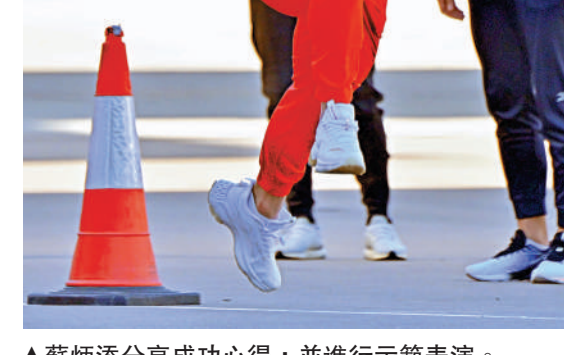
▲蘇炳添分享成功心得，並進行示範表演。

孫一文：「還沒有吃到魚蛋，一直很期待。很可惜，沒有時間，因為這趟行程安排得比較緊。不過，以前來香港每次都會吃，所以也沒有什麼遺憾。我就是比較喜歡吃丸子這種類的，香港的咖喱魚蛋不是做得最好的嘛。這是奧運會之後我們（與香港健兒）第一次見面，見到之後格外親切，我們也有聊到近況，我們以前也會（和香港選手交流）。比如這次全運會，他們以前是在深圳訓練的，然後直接去的全運會比賽，之前我們在國外有一個訓練營，我們經常在一起訓練。我們在場下是朋友，在場上是對手，這就是競技體育的魅力。」