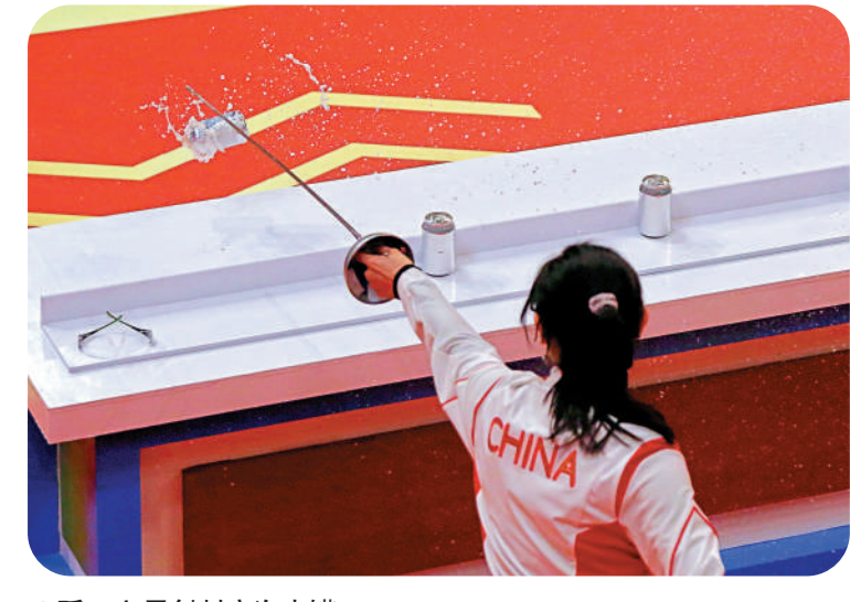
▲孫一文用劍刺穿汽水罐。