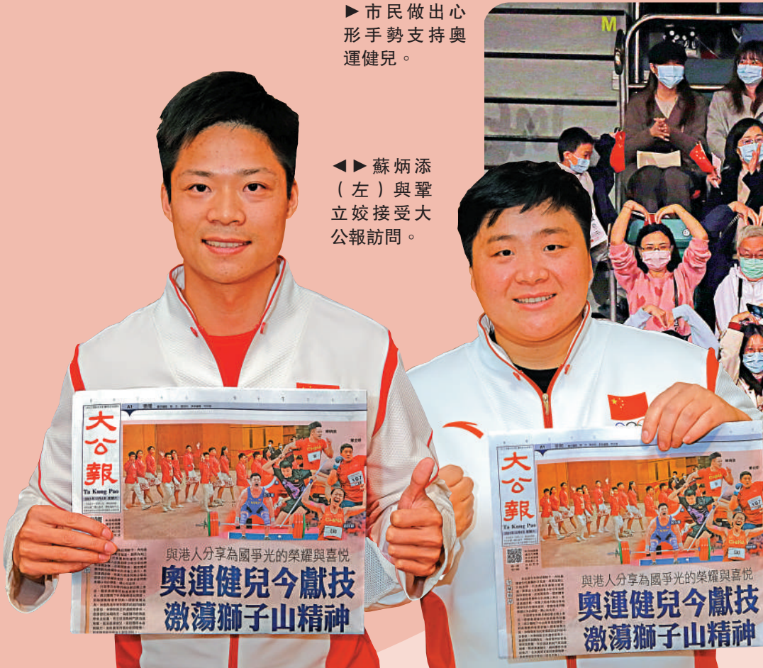
▲蘇炳添（左）與鞏立姣接受大公報訪問。