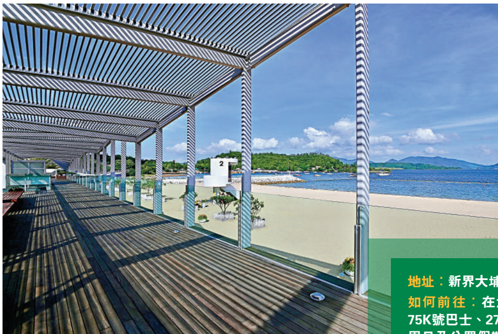
▲在大埔龍尾泳灘欣賞日落，為一天畫上圓滿句號。