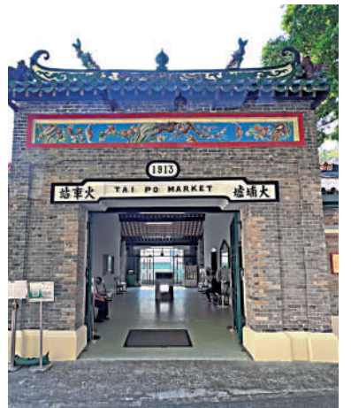
▲舊大埔墟火車站大樓建於1913年並使用至1983年，於1984年列為法定古蹟。

而供展覽的火車更是歷史感十足，其中的窄軌蒸汽火車頭就是自1924年至1928年在沙頭角支線行走；51號柴油電動機車則自1955年至1997年提供服務；歷史車卡112號正是1964年頭等車卡，設有梳化座位及餐椅；歷史車卡002號為1921年工程車卡，用作運送員工和輕便裝備進行維修工作等等。