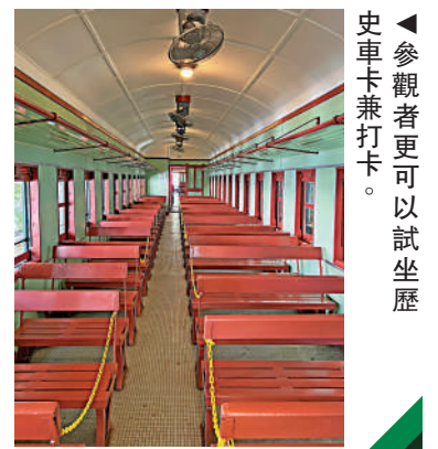
▲參觀者更可以試坐歷史車卡兼打卡。