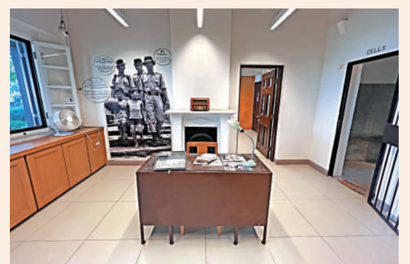
▲舊大埔警署的報案室仍然保留。