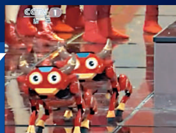
▲2021年春晚，機械狗上台表演，奪人眼球。