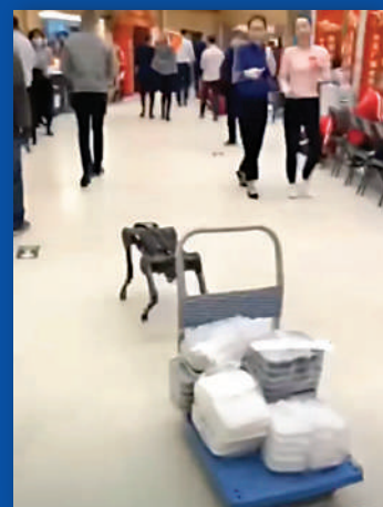
▲在2021年春晚後台，機械狗給演員送餐。

目前缺陷： 從全球範圍來看，由於四足機器人的機構仿生設計、模型結構設計複雜，且需要人工智能、柔性控制各類先進技術的關聯配合，導致四足機器人研發周期長，長期處於實驗室研究階段。