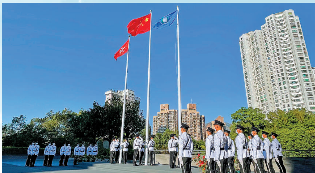
香港六大紀律部隊在國家憲法日舉行升旗儀式。