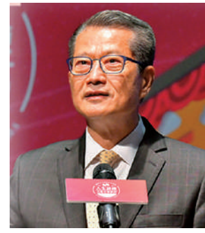
都是源自憲法的授權。

陳茂波表示，憲法是國家的根本法，是治國安邦的總章程，具有最高的法律地位和效力。憲法確立了國家的憲制秩序，也是基本法的立法依據和權力來源。憲法和基本法共同構成香港特區的憲制基礎。「一國兩制」的方針、基本法的存在和香港特別行政區的設立，依據