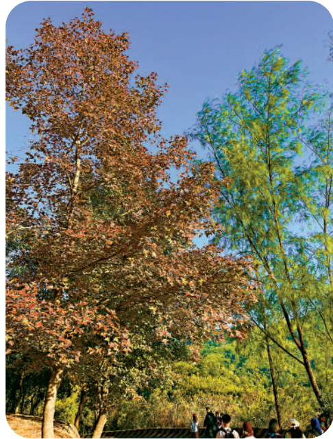
▲►樹葉由綠轉黃再轉紅，產生漸變層次。