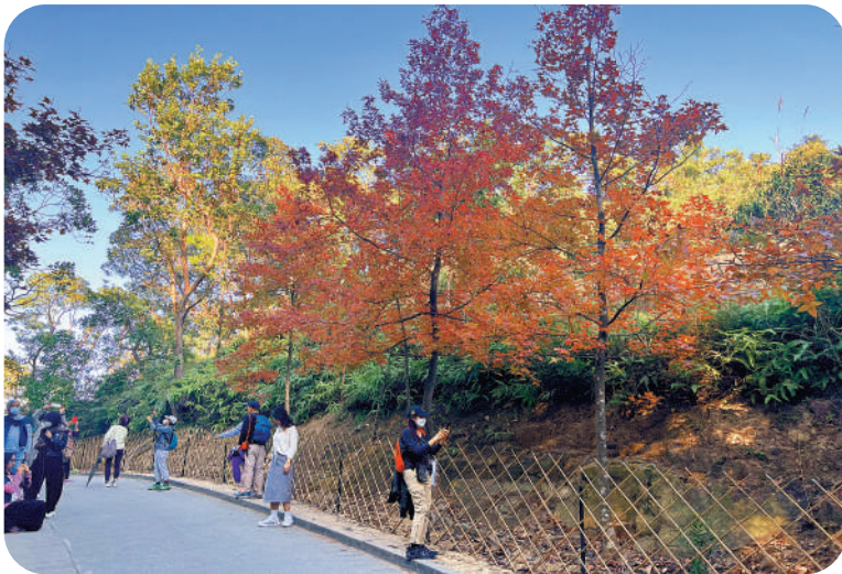
▲儘管是平日，仍有不少人前往打卡。