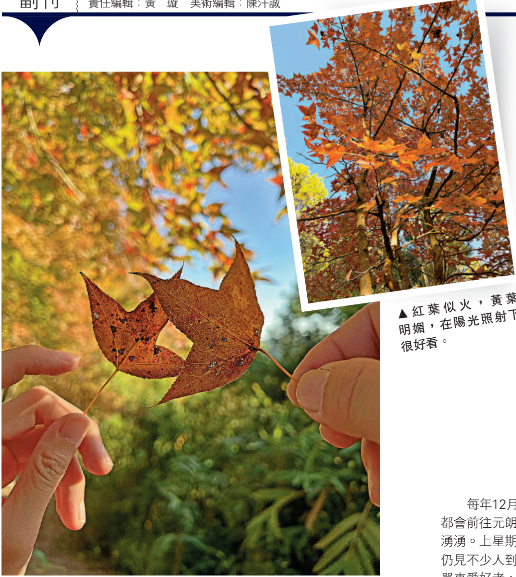
▲紅葉似火，黃葉明媚，在陽光照射下很好看。