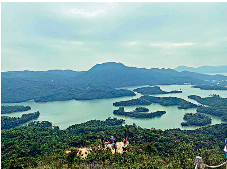
▲高處俯瞰大棠涌水塘甚為壯觀，難怪這兒有「迷你千島湖」之稱。