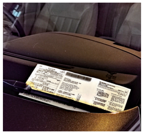
▲「咪錶霸」無入錶，有車主因而慘被抄牌。

警方則呼籲市民切勿光顧非法代客泊車服務，以免助長歪風，且可能因無入錶而被票控，亦可能違反車輛保險條款。