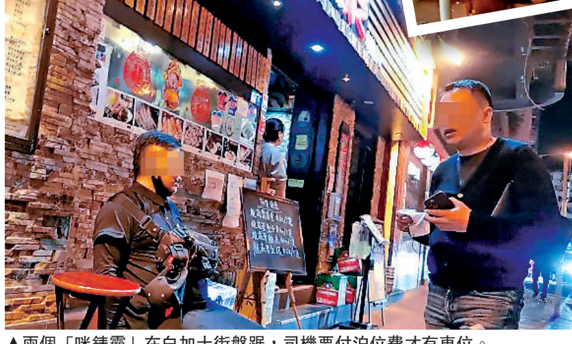
▲兩個「咪錶霸」在白加士街盤踞，司機要付泊位費才有車位。

繼警方今年七月搗破霸佔佐敦「八文樓」一帶咪錶位長達30年的咪錶街霸後，大公報記者近日發現，一度沉寂的「咪錶霸」再度活躍。