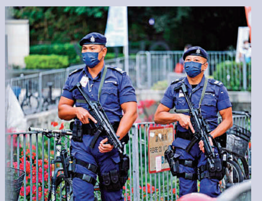
▲機場特警人員荷槍實彈，巡查票站附近範圍。

Conet」票站及附近一帶範圍巡邏，當中警員手持長槍，同時出動警犬協助執行任務，至晚上7時許，30多名反恐特勤隊人員前往將軍澳調景嶺體育館荷槍實彈戒備，其間徹底巡查票站內外，觀察有無可疑情況。警方指，雖然本港目前的恐襲威脅級別維持中度水平，亦無具體情報顯示可能成為襲擊目標，但警隊仍然時刻戒備，持續評估形勢和收集情報，以防範本土恐怖主義滋生。