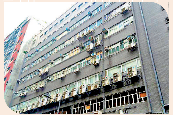
▲有候選人建議，政府可善用區內空置工廈，以優惠的價格租給年輕人做工作室，為青年創業者減輕租金負擔。