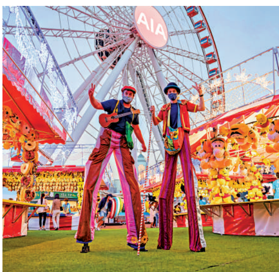
▲「冬日摩天輪」活動布置成聖誕市集，並設有攤位遊戲。