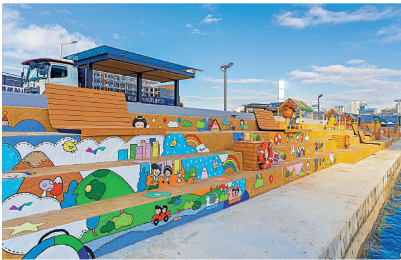
▲維港首個「海岸堤階」和水上運動康樂主題區（第二期）完工，將於平安夜正式開放。