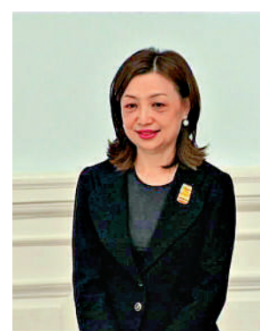
▲王沛詩獲委任為港大校務委員會主席，明年1月1日起生效。

港大校長張翔歡迎王沛詩獲任命，亦感謝李國章過去六年擔任校委會主席期間對大學作出的重大貢獻，以其遠見和領導才能帶領大學應對不同挑戰。教育局局長楊潤雄亦歡迎王沛詩出任港大校務委員會主席，並感謝李國章任內繼續發揮港大作為世界頂尖大學的優勢，亦積極與內地及其他地區聯繫，推進港大的國際化進程。