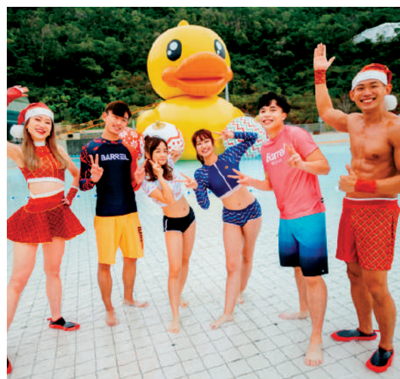
▲海洋公園水上樂園舉辦聖誕派對，大量卡通公仔供「打卡」。

海洋公園表示，水上樂園加設暖燈、室內暖水及暖氣恆溫設施，並推出限定「水上樂園無限次入場證」，成人票價488元，小童票價340元，可由即日起至明年3月23日無限次進入水上樂園玩樂。