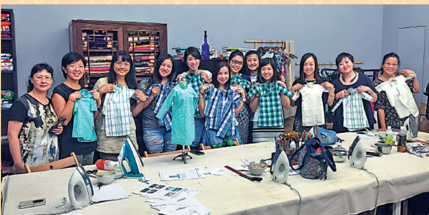
▲華服學堂開設的BB長衫製作體驗班。

記得某日沒有提前約定，記者來到股家萬師傅位於佐敦寶寧商場的店舖。探頭一看，六七十呎的店內，股師傅一邊埋頭「密密縫」，一邊聽收音和傾偈。待記者「自報家門」，他笑笑指了指牆上掛着裝裱的報紙，細看原來是股師傅兩年前接受記者所屬報社的採訪版面。於是記者請求「觀摩」一陣，他點頭。無論八十五歲的股師傅仍在聯合裁剪教班，還是六個「後生」在自己的位置耕耘，這不就是「傳承」嗎？