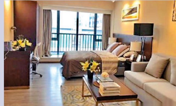
▲珠江國際公館交樓附帶精品裝修及廚房電器。