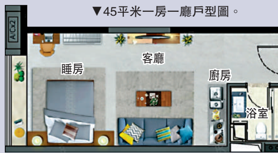
▼45平米一房一廳戶型圖。