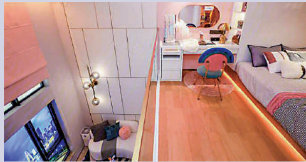
▲華新方圓·333的LOFT戶型樓底特高，可分隔工作區和生活區。