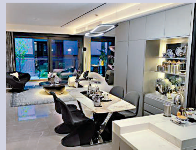
▲中海觀瀾府面積124平米的示範單位，客飯廳裝修豪華。