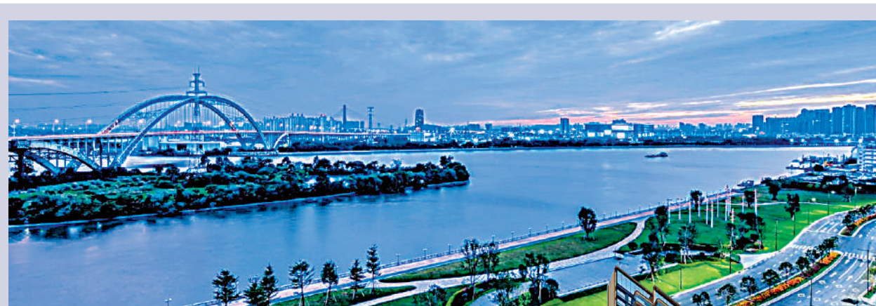
▲中海觀瀾府坐擁豐富珠江景觀。