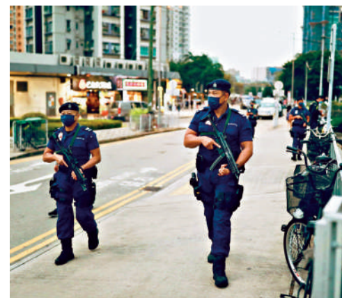
警方調配包括軍裝、便裝和特種部隊人員在內超過一萬警力，致力確保今日立法會選舉順利進行。

秩序和安全的行為，必定會果斷執法。發言人重申，在選舉期間藉公開活動煽惑他人不投票及不投票，有關行為不論在香港或在其他地方作出，均可能觸犯《選舉（舞弊及非法行為）條例》。發言人提醒市民，切勿參與煽惑或轉載相關違法內容，否則很可能需要承擔法律責任。強調對任何不法行為，特區政府必定嚴正執法，不會讓違法分子逍遙法外。