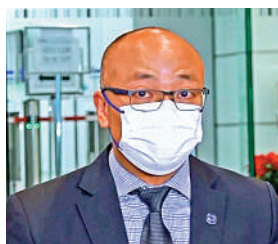
警方網絡安全及科技罪案調查科總督察戴子斌

另外，根據《選舉（舞弊及非法行為）條例》，在選舉期間內藉公開活動煽惑另一人不投票或投無效票，不論在境內或境外，以至互聯網，即屬違法。