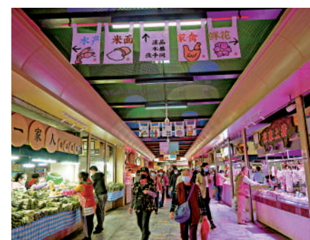
▲菜市場的煙火氣，與東山口民國小資情調相互映襯，形成當地獨特的文化氣息。