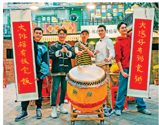
▲內地綜藝節目《大灣仔的夜》宣傳照。

1984」一定會感到莫名的熟悉，因為主人家就是想要一間「特別具有電影場景感的民宿」，為此根據他們喜愛的電影，設計改造了五間房：法國藍的巴黎房、馬卡龍色的布達佩斯房、藍黃配的波斯房、紅綠撞色上海房、素雅的台灣房。除了住下來體驗不一樣的電影氛圍外，「覺園1984」還不定期舉辦豐富多彩的活動，包括小型音樂會、讀書分享會等；不管是與音樂發燒友聽一個下午的磁帶，還是在林徽因描述的「太太的客廳」裏《細說紅樓夢》，或是參加一次和果子課程，甚至僅僅是來這裏喝個下午茶，都能從不同的元素裏去感