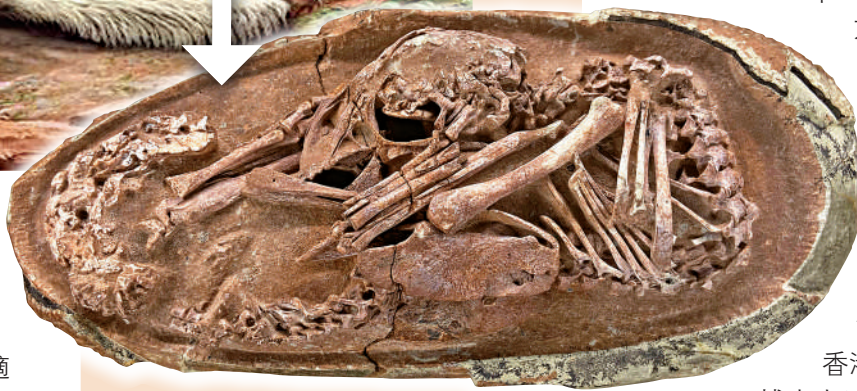
▲恐龍胚胎化石「英良貝貝」在福建展出。