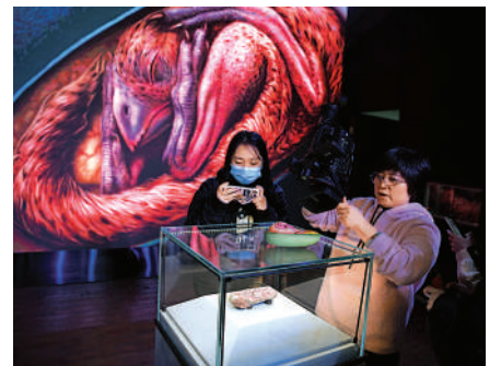
▲12月22日，遊客在參觀恐龍胚胎化石「英良貝貝」。

根據標本短高且無牙的頭骨，「英良貝貝」被確定為竊蛋龍類。通過將「英良貝貝」與其他獸腳類、蜥腳類恐龍和鳥類的胚胎進行比較，研究團隊提出，原本被認為是鳥類所特有的收縮行為，可能最早是從幾千萬年或幾億年前的獸腳類恐龍中演化而來的。