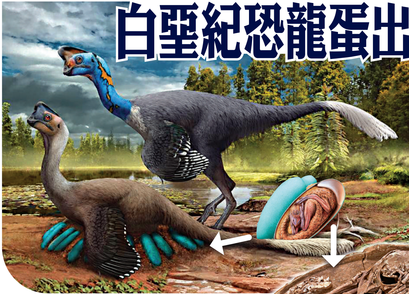
圖為復原一隻雌性竊蛋龍在孵蛋的情景。