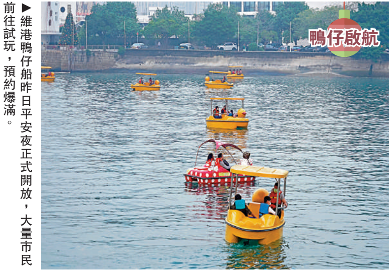
維港鴨仔船昨日平安夜正式開放，大量市民前往試玩，預約爆滿。