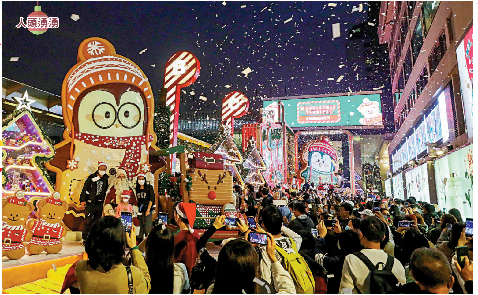
尖沙咀海濱商場舉辦慶祝活動，撒下白色紙碎，營造飄雪效果，現場人頭湧湧，氣氛十足。

有市民表示，過去兩年因黑暴及疫情，節日都不敢外出。隨着國安法實施，社會逐漸恢復平靜，加上本地疫情持續受控，終於有心情享受佳節，希望明年聖誕疫情過去，毋須再戴口罩。有市民說，以往聖誕節都會外遊，今年留港慶祝，感覺氣氛熱鬧。