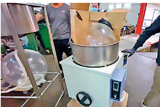
▲警方根據線報搗破一個製毒工場，檢獲大量製造冰毒的工具和化學原材料。