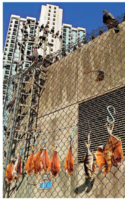
▲有市民竟在野鴿聚集處晾曬鹹魚，衛生情況令人震驚。