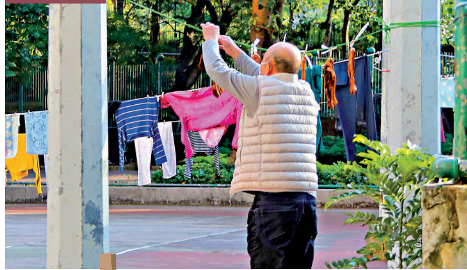
將軍澳景林邨有老翁在球場空地晾曬臘肉，他表示這些臘味是自家食用。