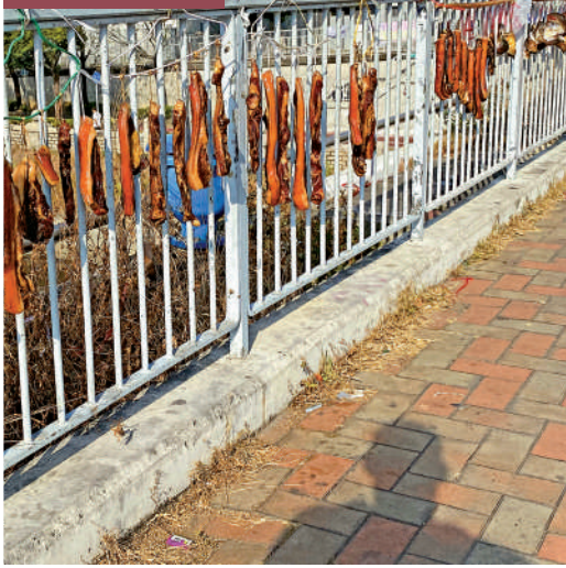
▲天水圍行人天橋欄杆上掛滿了各式臘味、鹹魚等，排出奇景。