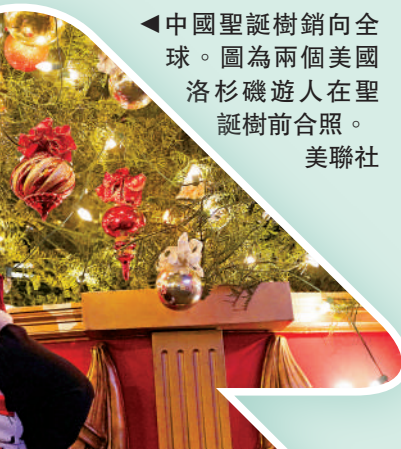
▲中國聖誕樹銷向全球。圖為兩個美國洛杉磯遊人在聖誕樹前合照。