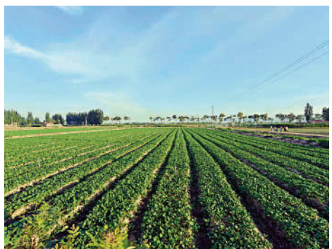
▲廣東供港蔬菜企業雙暉農業的一處蔬菜基地。

合打邊爐的蔬菜比較熱銷。」香港的每日新鮮蔬菜供應，有大部分是來自鄰近的廣東省。廣東是內地輸港食品的最大供應地，其中廣州海關監管的生豬、禽肉、生乳和中藥材分別約佔內地供港澳總量的44%、30%、70%和80%。 大公報記者 盧靜怡