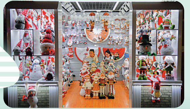
▲義烏國際商貿城的一家商店陳列着各式聖誕商品。