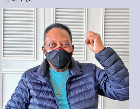
比利已出院並在家歡度聖誕節。

院，在完成今年最後一次療程後，亦透露自己接受了小小的化療程序。這位3屆世界盃冠軍近年健康備受關注，之前接受腎部手術後持續感到痛楚，現時亦行動不便。