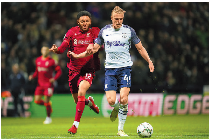
好。蘭歷克認為聯賽盃由低組別聯賽球會競逐會更好。資料圖片

曼聯在之前兩輪英超受變種病毒侵襲，只有不足10名一隊球員可以候命，兩仗也被逼延期。如今蘭歷克透露，周四已有25名球員出席操練，他亦重申會方鼓勵球員接種疫苗，希望旗下所有球員為己為人，承擔社會責任。