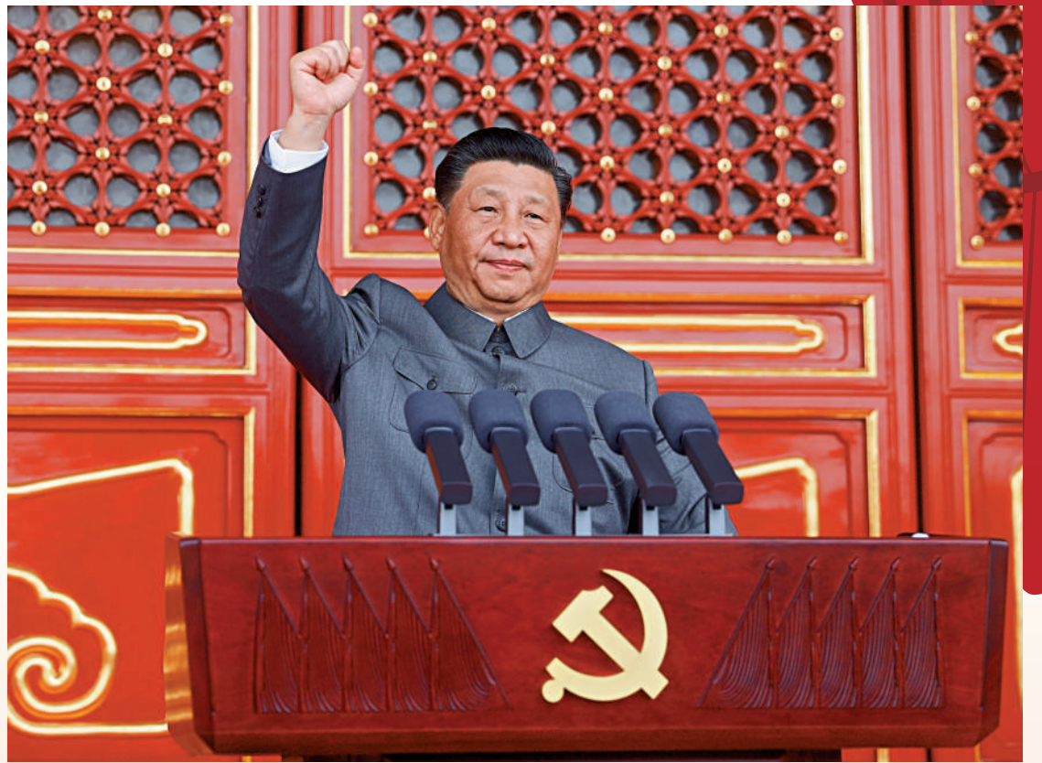
▲2021年7月1日，慶祝中國共產黨成立100周年大會在北京天安門廣場隆重舉行。中共中央總書記、國家主席、中央軍委主席習近平發表重要講話。