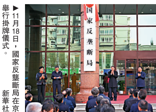
▲11月18日，國家反壟斷局在京舉行掛牌儀式。

9月，中共中央、國務院印發了《全面深化前海深港現代服務業合作區改革開放方案》和《橫琴粵澳深度合作區建設總體方案》。《前海方案》擴容擴區，有利於推動更高水平的港深合作；《橫琴方案》是支持澳門經濟適度多元發展、豐富「一國兩制」實踐的重大舉措，將為澳門長遠發展注入新的動力。