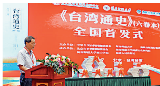
▲2021年，大陸對極少數「台獨」頑固分子依法實施懲戒。圖為7月17日，兩岸學者合著的《台灣通史》在京首發。 新華社

11月5日，國台辦發言人宣布，大陸將針對蘇貞昌、游錫堃、吳釗燮等極少數「台獨」頑固分子，依法實施懲戒。這是大陸方面第一次明確針對「台獨」頑固分子提出具體懲戒措施，同時向島內「台獨」分裂勢力發出警告：不要觸碰分裂國家的紅線，更不要低估大陸打擊「台獨」的決心，否則清單在列，終身追責。