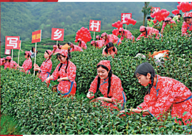
▲3月14日，靠種植白茶脫貧致富的茶農在四川省大竹縣團壩鎮茶園採茶。