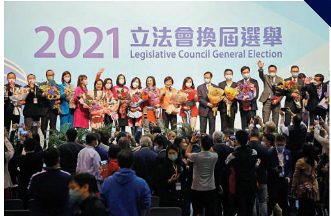
▲香港特區立法會選舉日前圓滿結束，圖為部分當選者合影。 大公報攝