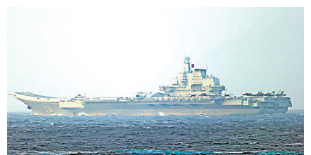
▲4月，中國海軍遼寧號航母駛向太平洋。

4月和12月，中國海軍遼寧號航母編隊兩度駛向太平洋。8月6日到8月10日，南海某片區域被劃定為演習區域，解放軍在其中舉行軍事演習。從公布的經緯度坐標推算，整個演習面積達到近10萬平方公里，是解放軍海上演習佔用海域面積最大的一次。一系列行動有力回擊了境外勢力妄圖干涉中國內政及主權的囂張氣焰。