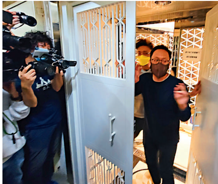
▶警方國安處人員在《立場新聞》辦公室搜證後，現場仍有員工出入。