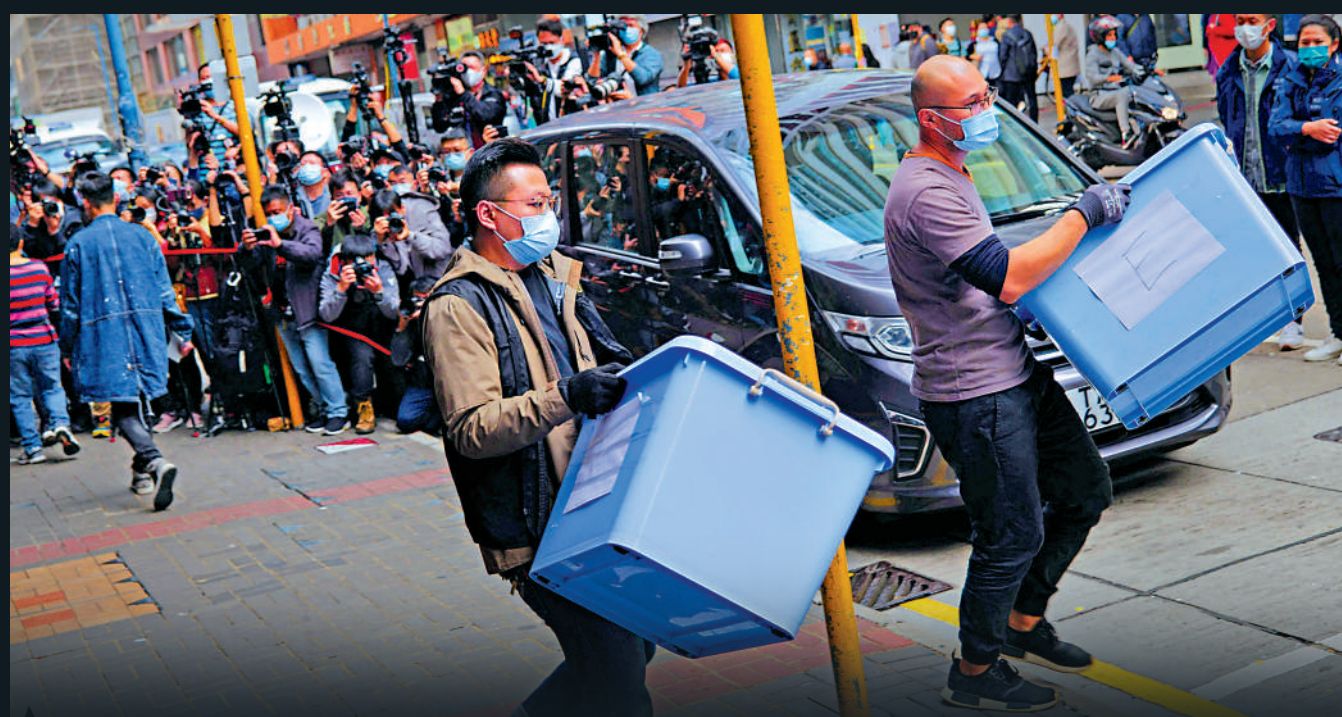
◀警方於《立場新聞》辦公室檢走多箱證物返署作進一步調查。