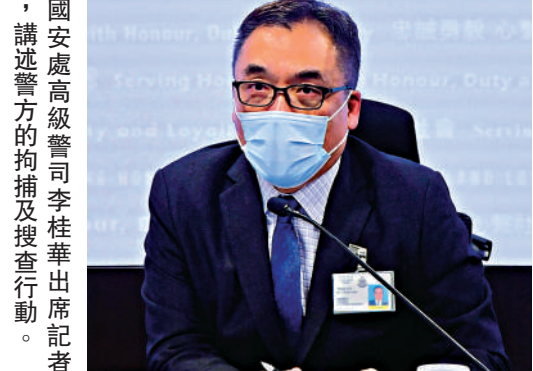
▶國安處高級警官李桂華出席記者會，講述警方的拘捕及搜查行動。

他舉例說，該網媒文章中曾形容香港的所謂抗爭者「被失蹤」和「被侵犯」，這些文章刊登時間在香港國安法實施後，全部毫無事實根據的惡意指控；另外，形容某宗案件的審訊中，