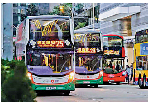
▲多家巴士公司巴士線明年起陸續加價。

今年4月4日起約350條九巴獨營路線首階段平均加幅為5.8%，51條聯營過海路線為8.5%，與新巴城巴聯營路線亦加價，此次因應2020年政府批准新