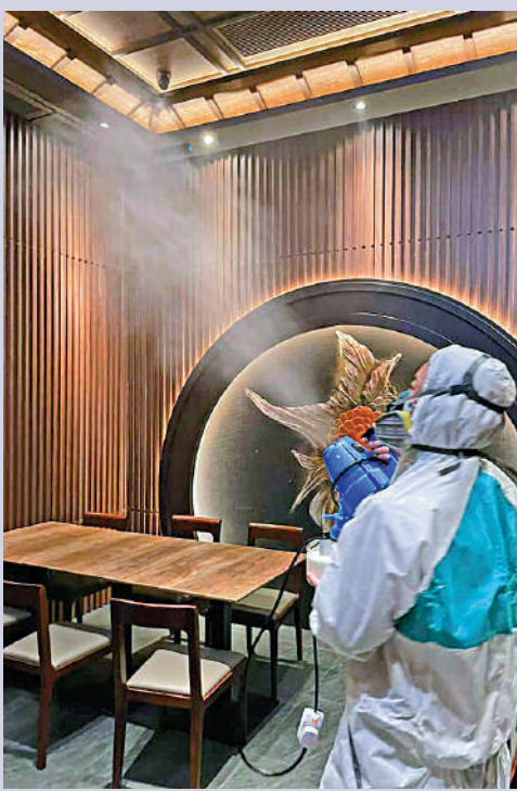
▲望月樓全店進行徹底消毒工作。