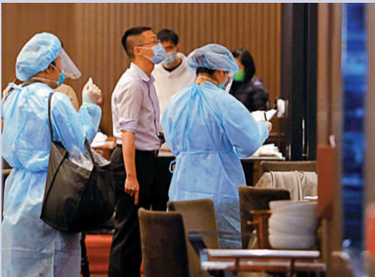
▲衛生防護中心昨日聯同多個政府部門人員到「望月樓」視察，採集環境樣本。

三人居住的大廈與村屋昨晚分別被圍封強檢或列入強檢公告。望月樓及相鄰餐廳「鳥十」昨午關閉消毒，員工會進行檢測及醫學監察。專家擔心社區已有隱形傳播鏈，呼籲有病徵的人要盡快檢測。另外，國泰因機組人員豁免檢疫被取消，明年首季將大幅調整航班。