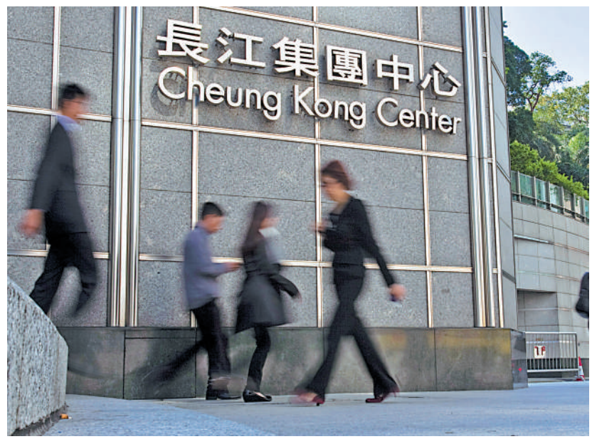
長和系股份呈強勢，有三隻之價值俱在四十九元，其中以長實最勁，有力挑戰上次增持價位即五十一元。

子，今日半日市收市價，才是真命天子所在也！我舉一隻實力股為例，此為越秀地產(00123)。受恒大事件的心理影響，該股由近10元直插至6.4元，近日才穩定下來。越秀今年確實比前勇進，不斷買地皮，採人棄我取策略。不過，越秀之進取，乃經過規劃和部署的，一是實力雄厚，為廣州市政府擁有的企業。二是投得優質地皮後，即處理融資問題。現在逐步公布多塊地皮已獲得財務