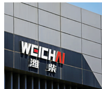
▲ 山東重工旗下的濰柴控股（香港）為Ferretti的大股東。