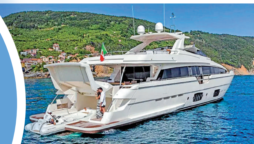
▲ 遊艇製造商Ferretti S.p.A.近期向港交所遞交上市申請，冀進一步開拓全球業務。