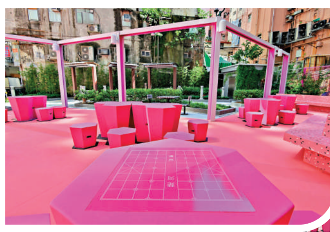
▲就連棋盤都是以粉紅色為主，非常可愛。