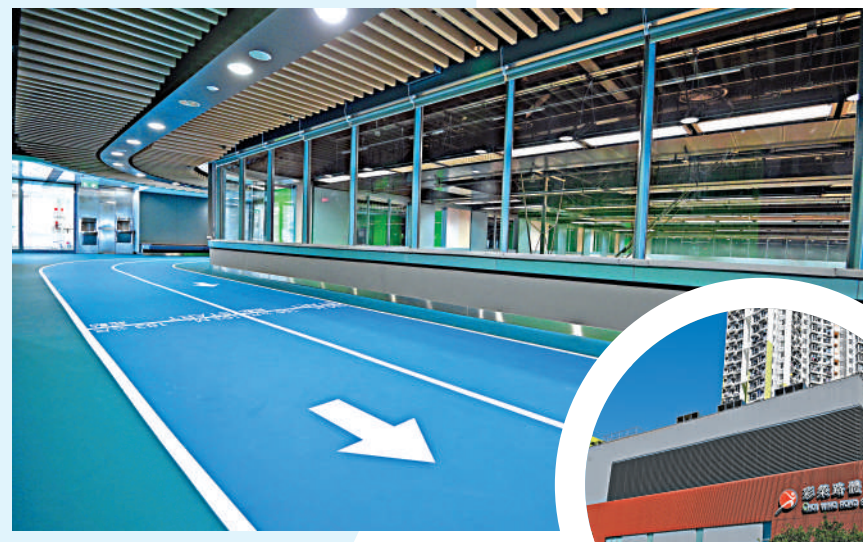
▲室內緩跑徑是彩榮路體育館的一大亮點。