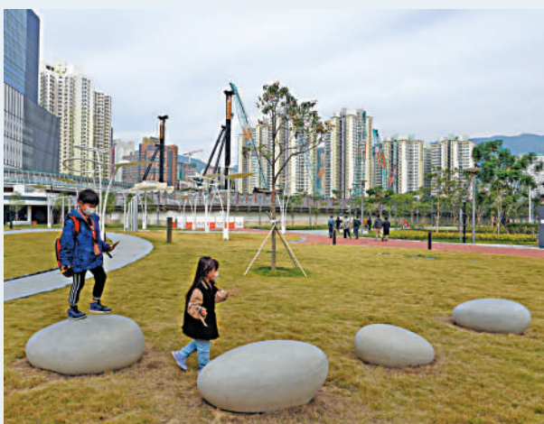
▲啟德大道公園的草地、裝置都非常美觀。