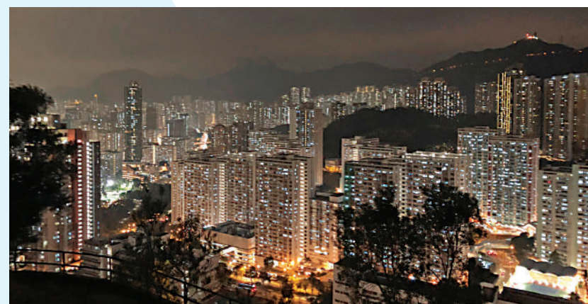
▲登上山頂，眼前萬家燈火，甚是壯觀。

雖然行石級很辛苦，當成功上到山後，望見腳下的萬家燈火，有種溫暖的感覺，更有一種「大地在我腳下」之感。不過由於冬天，所以記者晚上六、七點走上山已不見人影，所以就匆匆地落山了。