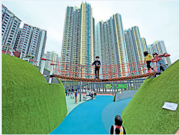
▲繩索橋只供5至12歲小朋友玩樂。

另外在附近，啟晴邨內的兒童遊樂場的遊樂設施及樓梯亦以啟德機場為主題，設有飛機、登機、離境等入口，外觀突出不在話下，適合讓大人小朋友偽坐飛機一番。而啟晴邨是位於啟德發展區1A區，前身為啟德機場內皇家香港輔助空軍基地，更前身為九龍十三鄉之一的沙地圍鄉。