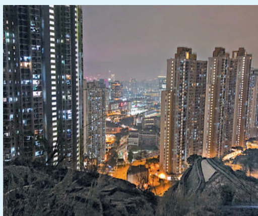
▲九龍灣彩德邨後山有一條小徑可以登上一座小山，此山名叫平山。