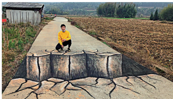
▲張樹平畫的「斷路」，幾可亂真。