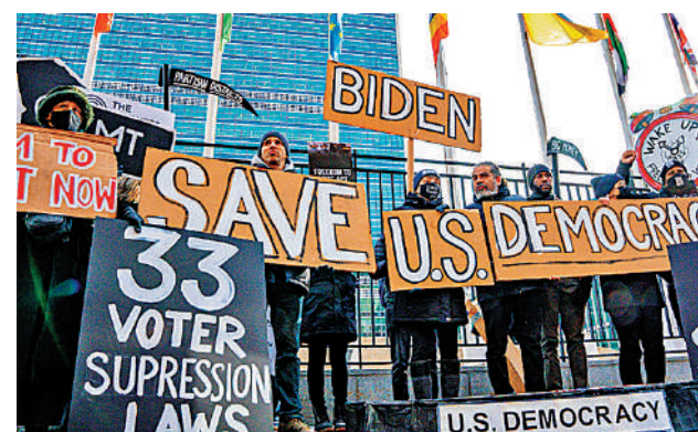
▲去年12月9日，美國民眾在紐約聯合國總部外舉行「民主葬禮」，要求拜登政府保護選民投票權。資料圖片

然而，民主黨參議員曼欽4日表示，他不支持民主黨的投票權法案。曼欽此前「一人綁架整個參議院」，成功阻撓拜登的1.75萬億美元社會開支法案通過。（路透社）