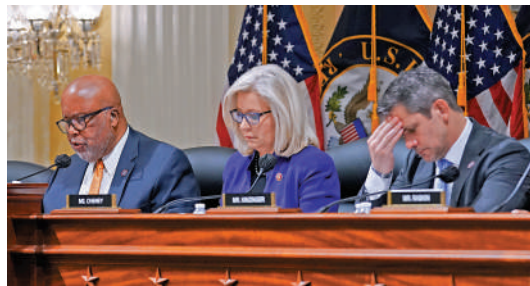
▲眾議院106事件調查委員會主席湯普森（左），及該委員會兩名共和黨成員切尼（中）、金辛格（右）。

由民主黨主導的眾議院106特別調查委員會在去年6月30日成立，包括7名民主黨人和2名批評特朗普的共和黨人。由於共和黨被看好在今年11月的中期選舉重掌眾議院，屆時肯定會解散106委員會，因此該委員會近期加緊調查工作。委員會主席湯普森表示，將在11月前發布最終調查報告。