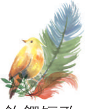
飲饌短歌 吃吃君 IG: mrcichi1988

前些年幾個泰豐樓的師傅出去自己單幹，在西環開了家好客山東，後來搬到上環。主要做的是山東餃子、燒雞以及一些麵食小菜，與泰豐樓所做的京魯菜和官府菜已大相徑庭。經營家鄉小菜似乎成為目前許多北方人居港後進軍餐飲的主要路徑，畢竟所謂官府菜在這個年代有些高和寡，技術和資金要求都更高，做些北方日常菜品更容易生存，亦可解自己的鄉愁。