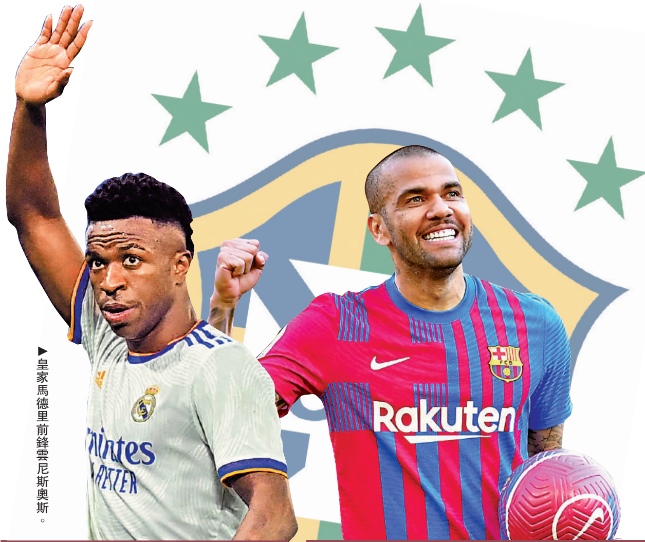
▶皇家馬德里前鋒雲尼斯奧斯。