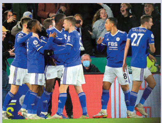
▲李斯特城陣中有多名球員傷缺。資料圖片