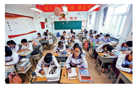
▲山西太原的高三學生正在備戰高考。

減課時、改變難度、調整進度，嚴禁高三上學期結束前結課備考。嚴禁法定節假日、寒暑假集中補課或變相補課。