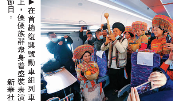
在首趟復興號動車組開行前，僑胞族群帶身盛裝表演節目。