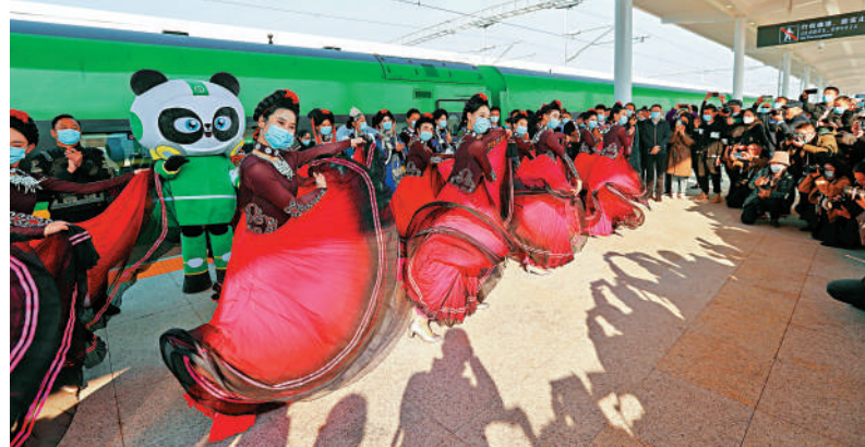
1月10日，在西昌西站，彝族自治州民眾歡慶復興號開進大涼山。圖為復興號動車組在西昌西站開行前，民眾歡慶。