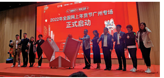
▲1月10日，2022全國網上年貨節廣州專場啟動，「廣州老字號數字博物館」正式上線。

為保障網上購置的年貨能及時送到消費者手中，春節期間廣州快遞行業將堅持「不打烊、不休網、不積壓」的基調。