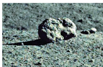
▲「神秘小屋」的真容——一塊石頭。網絡圖片