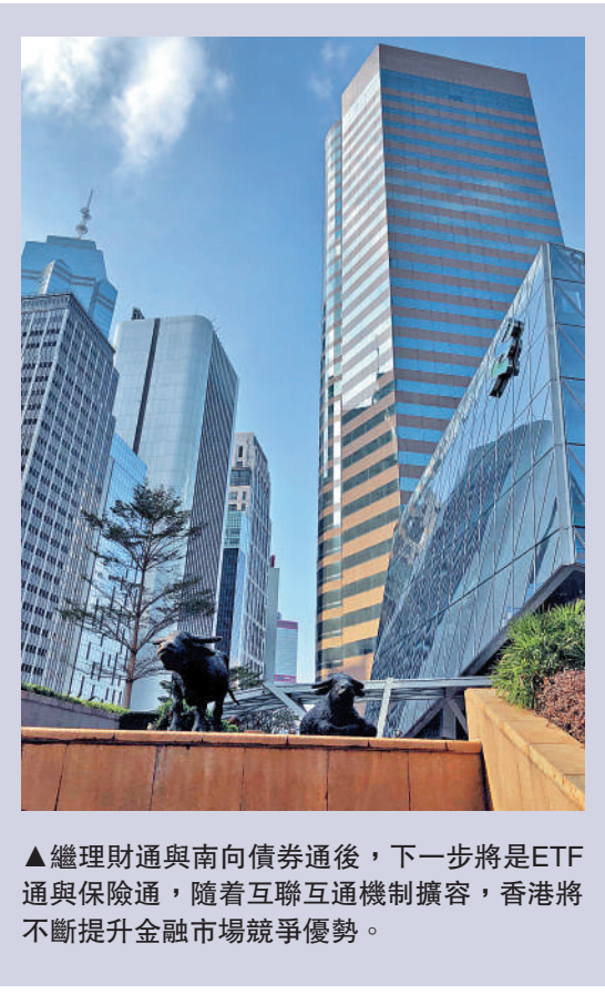
▲繼理財通與南向債券通後，下一步將是ETF通與保險通，隨着互聯互通機制擴容，香港將不斷提升金融市場競爭優勢。

密切期待ETF通保險通 同時，香港正爭取南向港股通以人民幣計價，未來內地投資者買賣港股更加便捷，可以直接使用人民幣交易，不但能夠刺激北水南下意欲，激活港股成交，還有助加速推動人民幣國際化。 其實，全球加配人民幣資產，正是透過內地與香港互聯互通機制、加速推動人民幣國際化的適當時機。繼理財通與南向債券通之後，下一步將是ETF通與保險通，從中可發揮香港所長、貢獻國家所需，助力人民幣國際化。隨着互聯互通機制擴容，香港聯通內地與國際的中介角色與功能將不斷提升，增強金融市場競爭優勢。 香港金融業發展處於黃金機遇期，港交所前景可以看高一線。