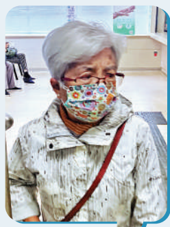
謝婆婆：唔知邊度仲可以打？