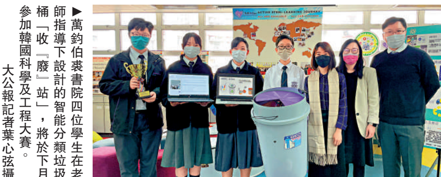
▲萬鈞伯裘書院四位學生在老師指導下設計的智能分類垃圾桶「收「廢」站」，將於下月參加韓國科學及工程大賽。