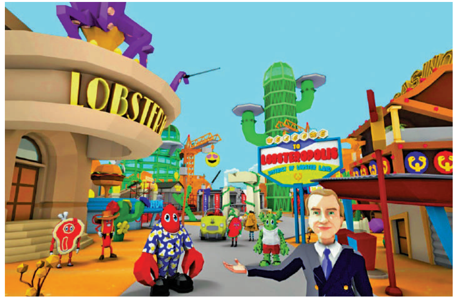
▲英國藝術家Philip Colbert在Decentraland買地後，建立「Lobsteropolis City」和「Lobster Land Museum」，作為NFT展覽的根據地。Decentraland官網

在筆者看來，地產項目以此概念拿地，對其他商業地產項目的區位、配套、品質等概念是降維打擊；汽車企業以此概念做銷售，一定能獲得讓消費者眼前一亮的銷售產品；文化企業用這個概念推廣其文化產品，將事半功倍。