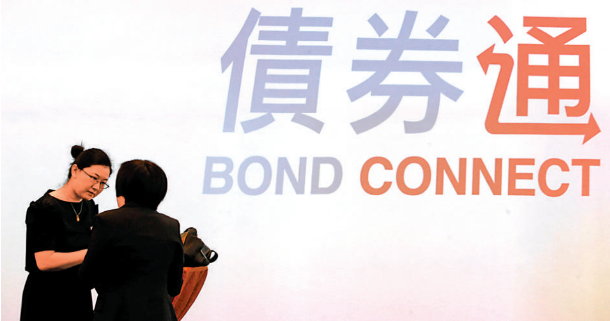
▲分析指出，債券通「北向通」自2017年開通以來，運行安全穩健，業務持續增長，逐漸成為境外投資者進入中國債券市場的重要渠道。資料圖片