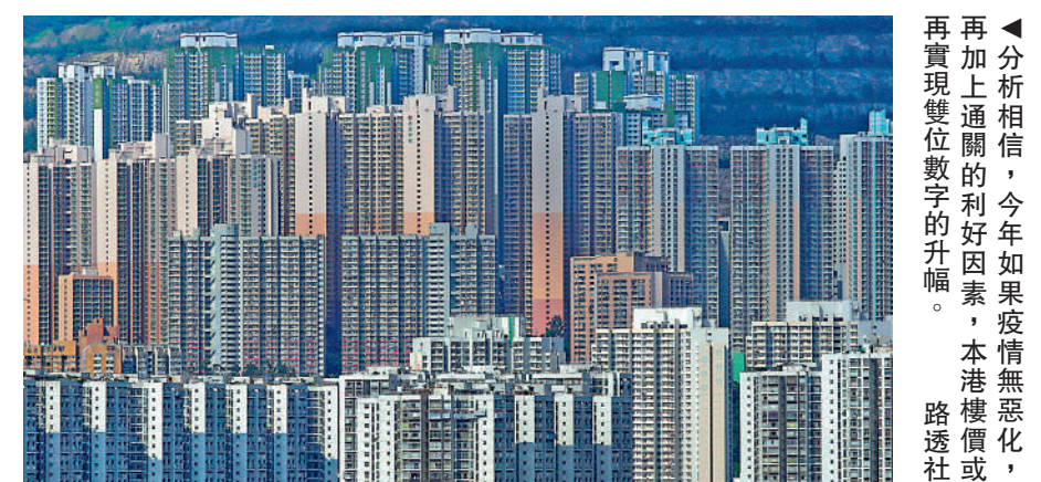
▲分析相信，今年如果疫情無惡化，本港樓價會再實現雙位數字的升幅。