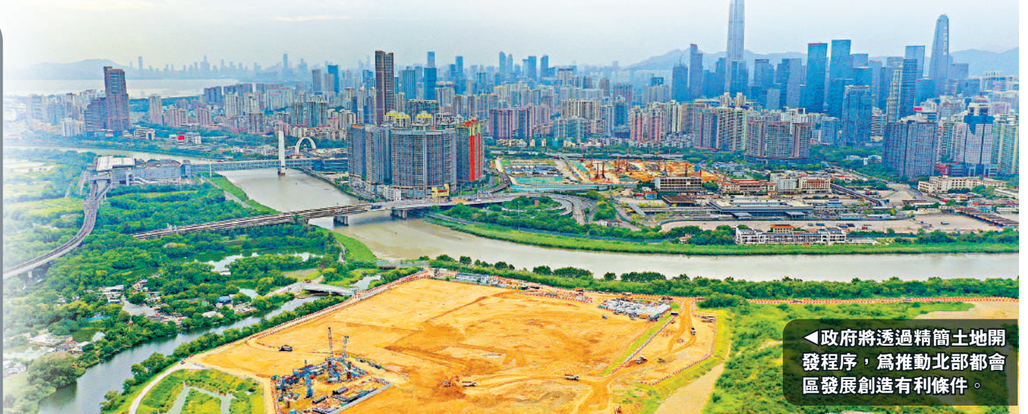
政府將透過精簡土地開發程序，為推動北部都會區發展創造有利條件。