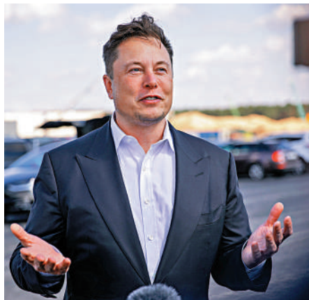
▲馬斯克一直公開表示熱愛狗狗幣。

【大公報訊】虛擬貨幣狗狗幣（Dogecoin）近日再成為市場焦點，特斯拉（Tesla）行政總裁馬斯克周五在社交平台推特（Twitter）表示，接受該幣購買特斯拉的周邊產品，消息刺激狗狗幣昨日一度突破0.2美元，高見0.2062美元，過去24小時升約兩成。