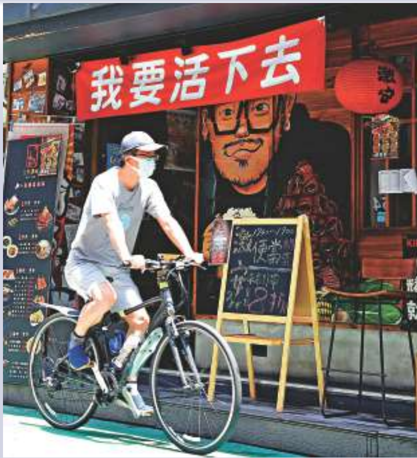
▲台灣爆發新一波本土新冠疫情，民眾減少外出用餐，餐飲業大受影響。資料圖片

【大公報訊】台灣地區流行疫情指揮中心17日宣布，新增65例新冠肺炎確診病例，包括48例境外移入及17例本土病例，其中本土病例創今年疫情單日新高。由於島內新冠疫情持續擴大，衝擊經濟，最新統計顯示，台灣有1981家企業實施無薪假，放無薪假人數共11247人，其中旅遊業放無薪假人數最多。台業界人士向大公報表示，由於疫情持續，民眾無法外遊，旅遊業預計今年上半年恐怕仍難以復甦。