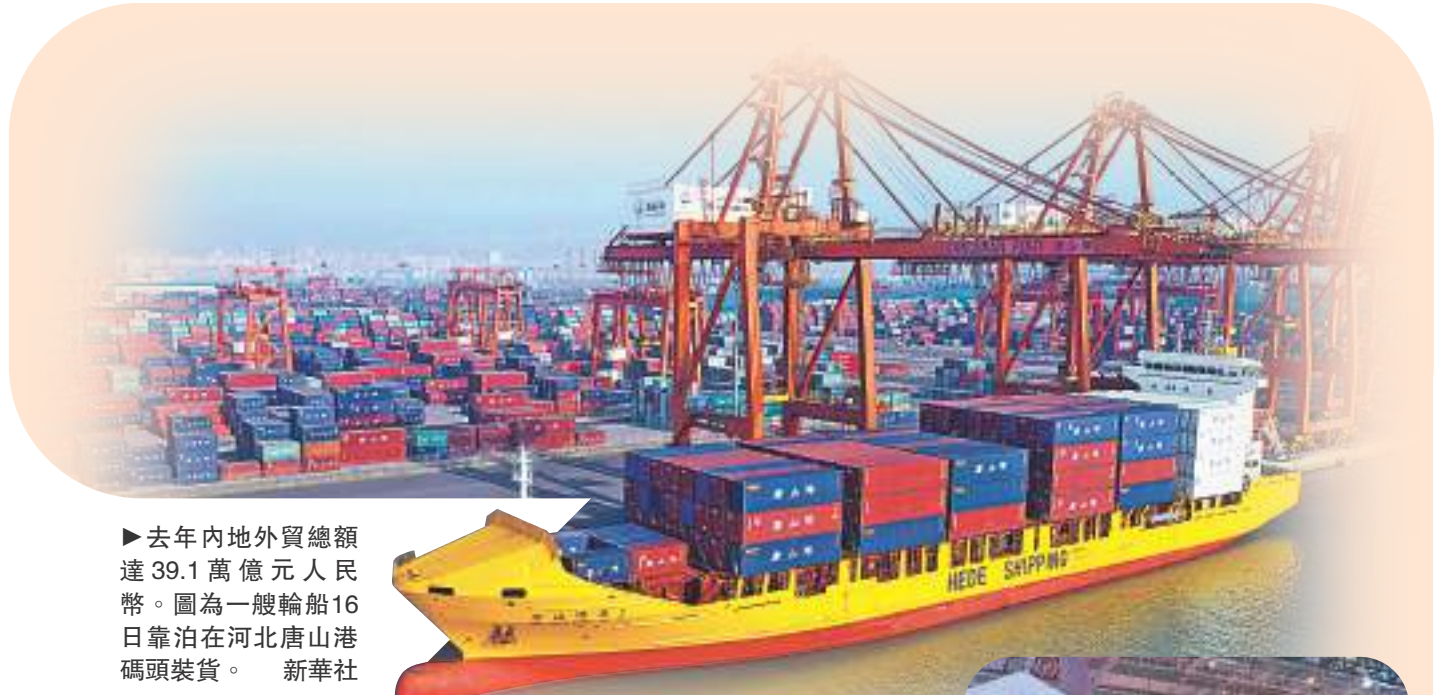
去年內地外貿總額達39.1萬億元人民幣。圖為一艘輪船16日靠泊在河北唐山港碼頭裝貨。