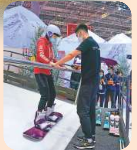
去年內地居民人均消費支出增長12.6%。圖為去年11月，參觀者在進博會消費品展區體驗室內滑雪。新華社