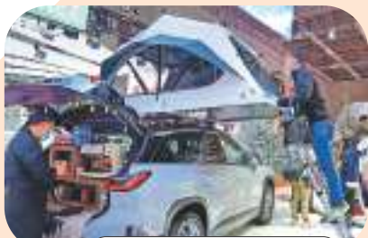
去年11月，參觀者在進博會消費品展區參觀汽車。新華社

寧吉喆表示，2021年四個季度同比增長雖逐季降低，但是每個季度環比增長卻在加大，表明中國的經濟規模在逐季擴大，經濟企穩態勢逐步顯現。他並特別提到，中國固定資產投資保持增長，2021年固定資產投資超過50萬億元，達到54.5萬億元，比上年增長4.9%。中國仍是世界上最大的發展中國家，擴大有效投資仍具有潛力和空間，隨着去年下半年以來加快地方政府專項債券發行節奏，以及中央預算內投資加快下達進度，適度超前開展基礎設施投資等政策正在發力。