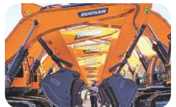
中國製造業邁向高質量發展，生產的工程車輛。圖為山東

中國居民收入增長與經濟增長實現基本同步。國家統計局發布的數據顯示，2021年，內地居民人均可支配收入35128元人民幣，比上年名義增長9.1%，扣除價格因素實際增長8.1%，與經濟增長基本同步；兩年平均增長5.1%，也與經濟增長基本同步。中央黨校（國家行政學院）經濟學教研部副教授蔡之兵表示，人均收入的增速與GDP增速持平，表明中國廣大居民充分享受了發展紅利，經濟發展與成果分享的差距逐步縮小。