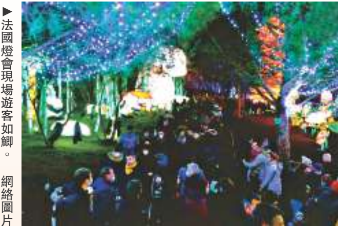
▲法國燈會現場遊客如鯽。