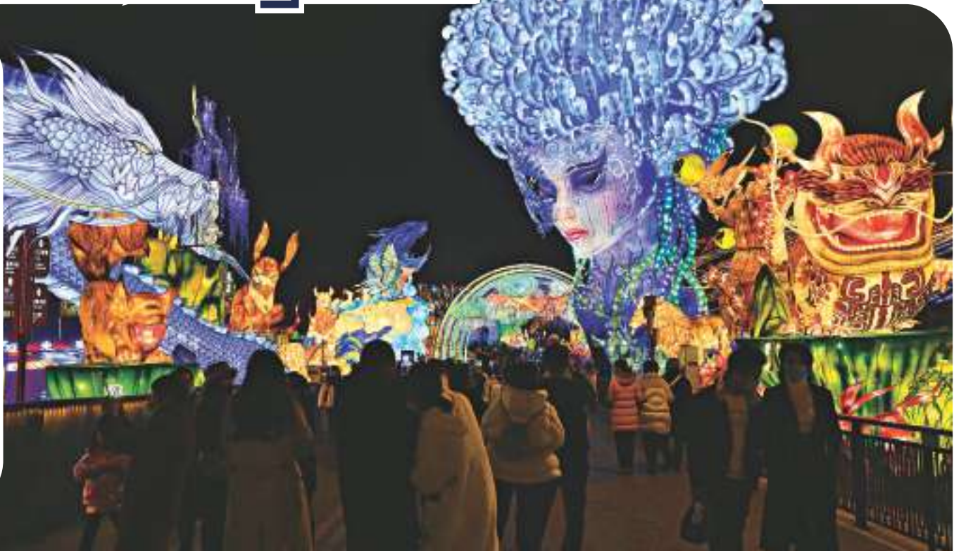
▲1月10日，四川自貢的中國·自貢中華彩燈大世界景区内燈火璀璨，讓遊客領略一場彩燈盛宴。