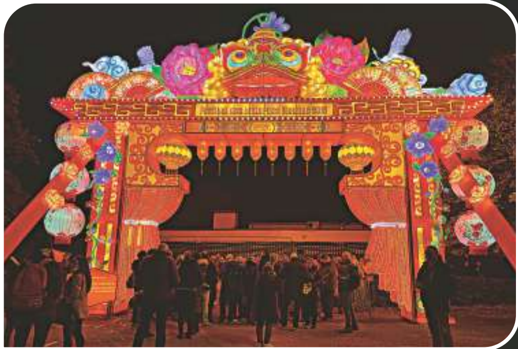
▲眾多遊客在法國布拉尼亞克市里圖雷特公園內的燈會入口等待入場。