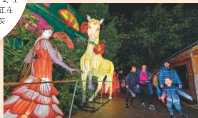
▲2021年10月28日，人們在愛爾蘭都柏林參觀由四川自貢燈彩集團舉辦的彩燈展。

自貢彩燈距今已有800多年的歷史，是中國國家級非物質文化遺產。彩燈款式豐富，場面宏大，極具民俗風情，有「天下第一燈」之譽。進入現代社會，自貢彩燈更加五花八門，恐龍、宇宙、科幻故事都可以做成彩燈，更應用了大量「聲、光、電」現代技術。近年來，自貢燈會更走出國門，來到美國、德國、日本、新加坡等全球80個國家和地區，成為國家名片之一。