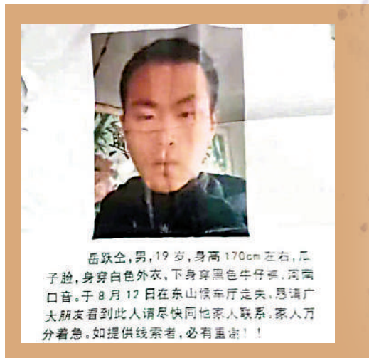
▲ 岳先生印了200多張尋人啟事，每到一地就會張貼。