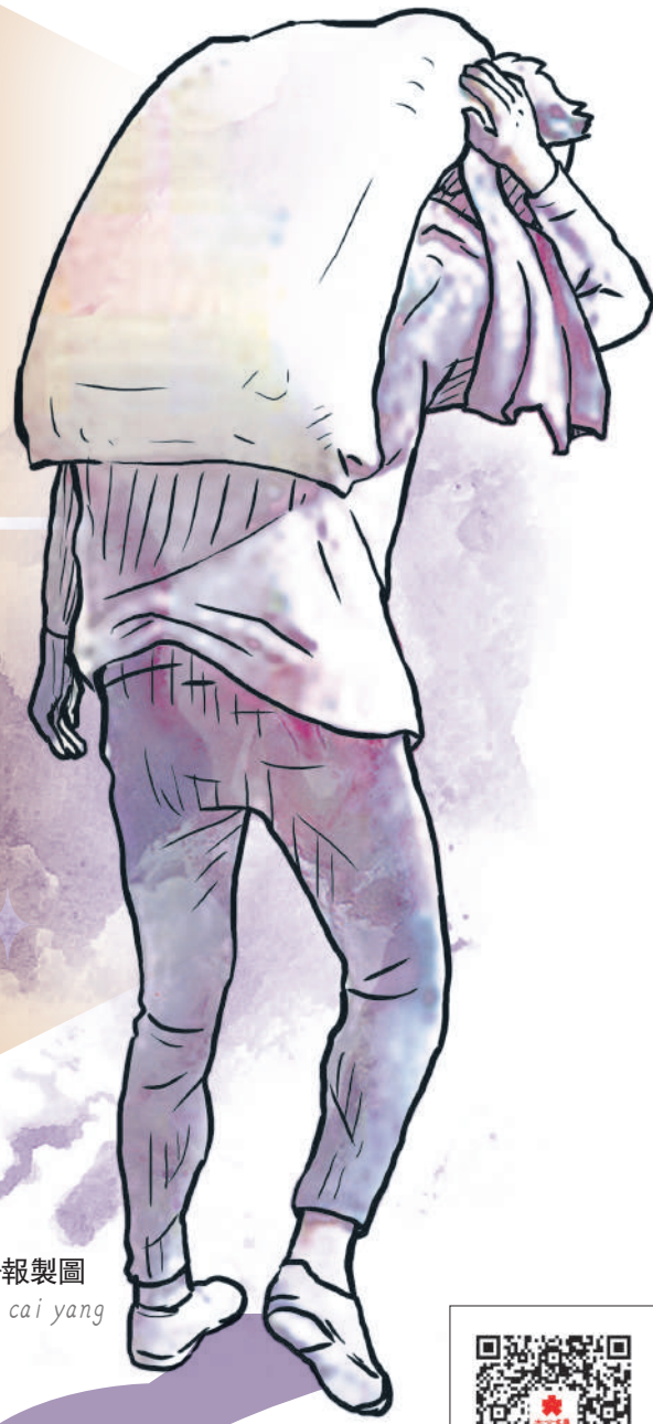
大公報製圖 cai yang