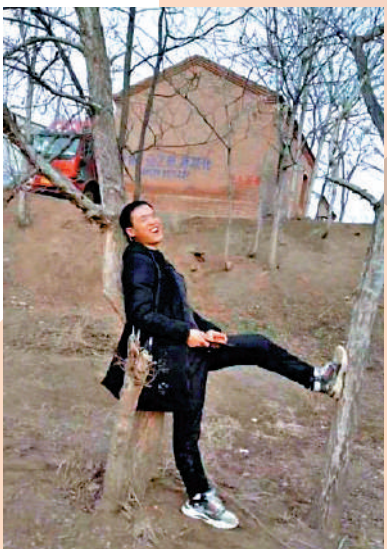
◀ 2020年8月12日，岳先生的大兒子走失。網絡圖片