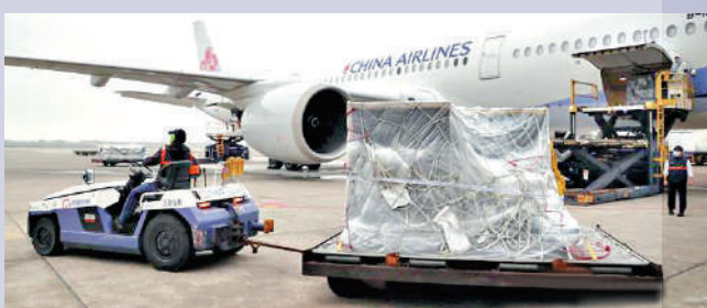
▲台企向上海復星醫藥集團購買的最後一批復必泰疫苗於27日抵台。