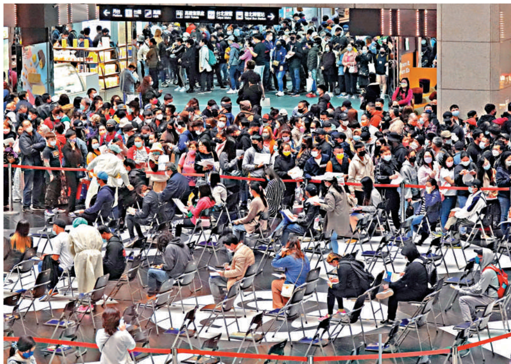
▲最近台灣本土新冠疫情持續擴大，不少民眾積極接種疫苗。圖為台北車站接種點大排長龍。

有台媒指出，台灣今年本地新冠病例接連不斷，至今371例本地確診個案中有235名確診者因餐廳傳播鏈條而染疫。桃園市長鄭文燦緊急公布餐廳堂食新規，包括堂食座位減半、離座須戴口罩等。台北市副市長黃珊珊27日也表示，餐廳堂食新規正在討論中，台北市府已規劃好「2.5級」防疫警戒標準程序，若疫情升溫，將公布新規定。