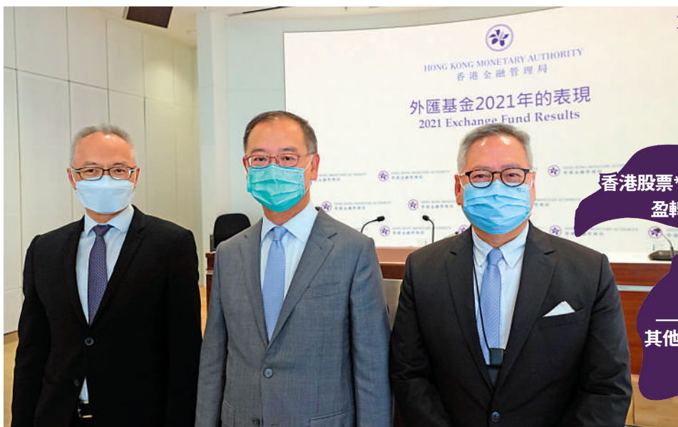
外匯基金2021年表現摘要 (單位：億港元)