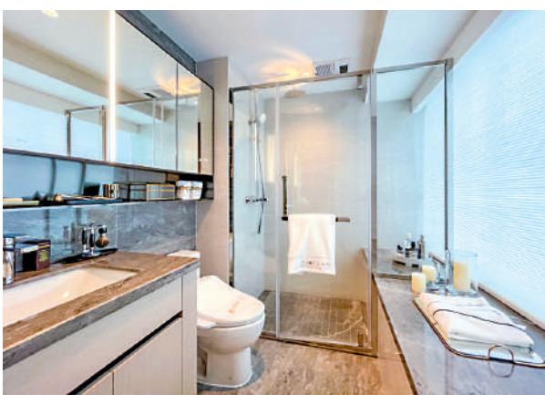
▲西關雅築示範單位浴室。