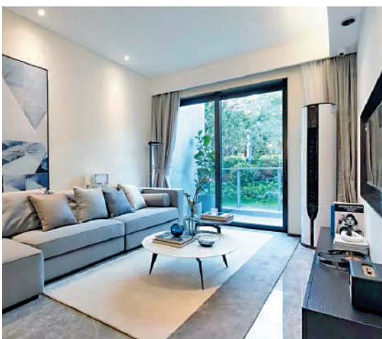
▲保利東郡示範單位客廳。

周邊配套方面，保利東郡附近，教育資源豐富，學校有廣船第一幼兒園、荔灣區東沙博雅實驗學校等，商場則有佳明商場（永安大街）、坑口康城購物中心（坑口店）、萬象商貿城、大笨象國際茶業城，滿足日常購物需求。