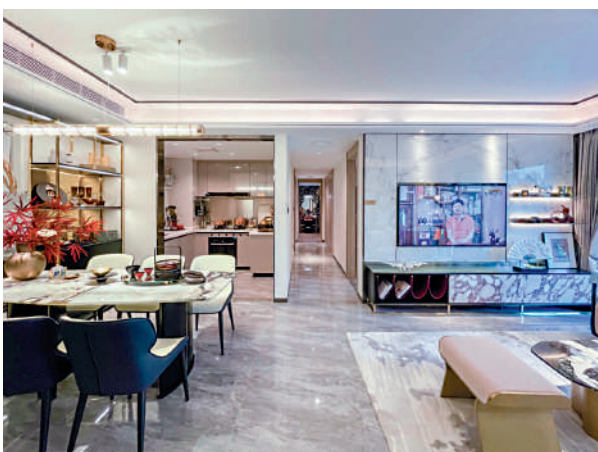
▲西關雅築示範單位客廳。

從項目乘坐電梯下樓後，可直接進入空中花園的建築中，這裏打造了「林間居游、廊間居游、水間居游」三大主題園林，為港人購房者提供了繁華與清淨雙重空間。