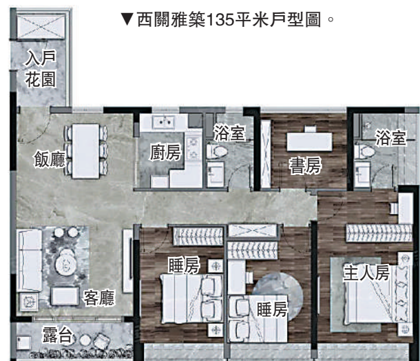
▼西關雅築135平米戶型圖。