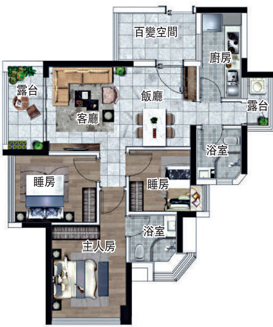
▲珠江西灣里89平米戶型圖。

室內裝修精裝配套完善，選材方面也頗為講究，多重智能系統，新風系統、智能馬桶、戶內一鍵呼梯，提升效率。