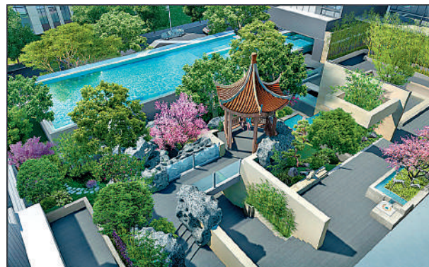
▲西關雅築項目小區效果圖。