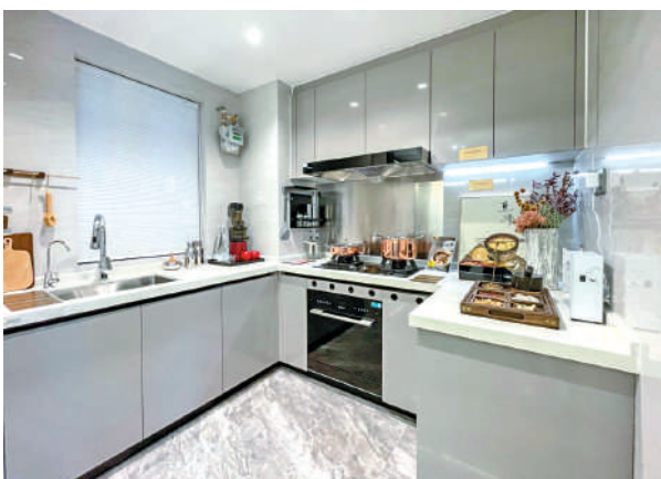
▲西關雅築示範單位廚房。