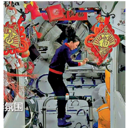
▲29日，神十三乘組在太空練習書法，王亞平下筆有神，娟秀大方。 視頻截圖